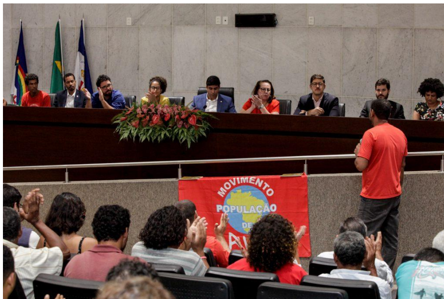
Figura 10 - Audiência Pública, Assembleia Legislativa de Pernambuco