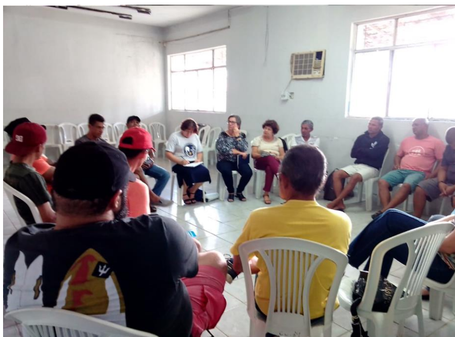
Figura 6 – Reunião do Coletivo Maria Lúcia, no Centro da Juventude de Santo Amaro, Recife Pernambuco

O Coletivo Maria Lúcia veio fortalecer a instituição do Movimento Nacional da População de Rua em Pernambuco. No ano de 2019, o Coletivo realizou várias reuniões para emponderar os seus componentes e simpatizantes no tocante a luta pela defesa e garantia de direitos.