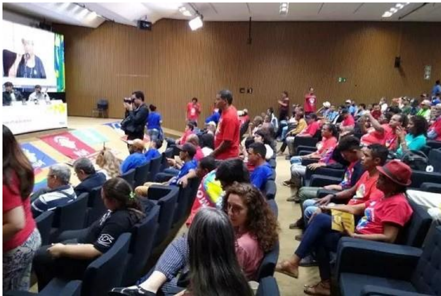
Figura 9 - Frente Parlamentar em Defesa dos Direitos da População em Situação de Rua Câmara Federal, Brasília – DF