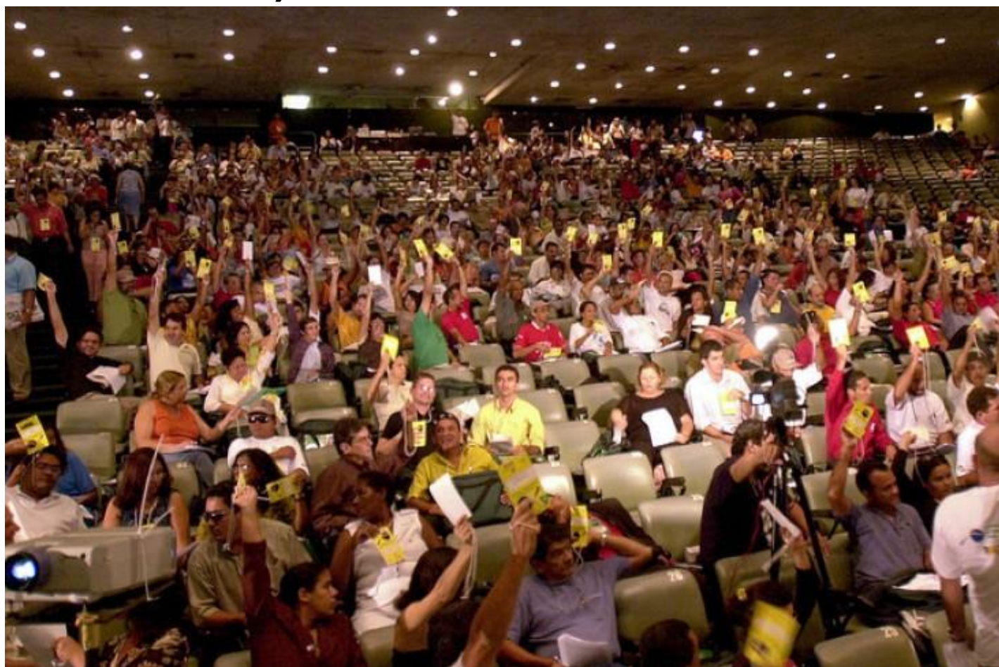
Plenária da 2ª Conferência Nacional de Segurança Alimentar e Nutricional, Olinda, 2004.