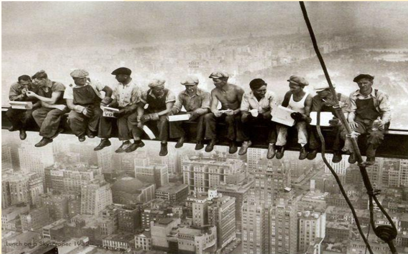
Lunch on a Skyscraper 1931