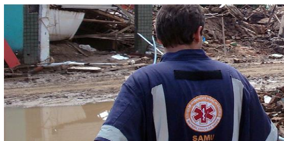
Equipes do SAMU em Alagoas e Pernambuco em 2008

Os esforços, de toda a equipe durante o processo de acompanhamento de famílias em situação de emergências sociais são inúmeros. Para minimizar os danos e garantir o retorno à vida cotidiana possibilitando a reconstrução da vida familiar e comunitária é necessário um trabalho articulado e extremamente atento aos impactos causados por estes eventos. Devem ser facultados atendimentos pelas equipes de saúde para as pessoas afetadas, especialmente, quando além das questões materiais, os eventos/situações registrarem perdas humanas.