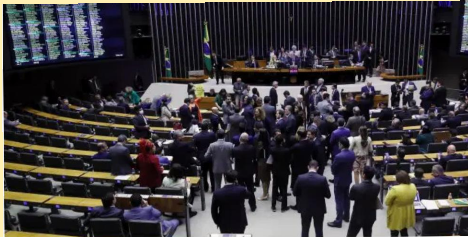
Arcabouço fiscal contou com apoio de ampla maioria na Câmara, recebendo 367 votos favoráveis e 102 contrários. Foto: Bruno Spada/Câmara dos Deputados CÂMARA DOS DEPUTADOS

Fonte: https://congressoemfoco.uol.com.br/area/congresso-nacional/mulheres-contra-mulheres-que-sao-as-deputadas-que-votaram-contra-a-paridade-salarial/