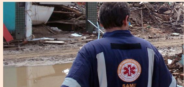
Equipes do SAMU em Alagoas e Pernambuco em 2008

Os esforços, de toda a equipe durante o processo de acompanhamento de famílias em situação de emergências sociais são inúmeros. Para minimizar os danos e garantir o retorno à vida cotidiana possibilitando a reconstrução da vida familiar e comunitária é necessário um trabalho articulado e extremamente atento aos impactos causados por estes eventos. Devem ser facultados atendimentos pelas equipes de saúde para as