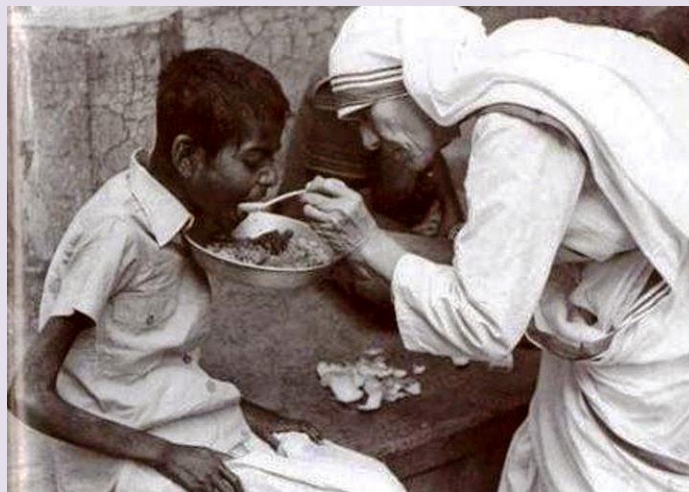
Foto da Irmã Dulce alimentando uma criança com visíveis indicadores de subnutrição. A imagem demonstra o papel que a caridade, em decorrência das crenças religiosas e religiões, exerceu junto às pessoas mais pobres e necessitadas, durante muitos tempo, na história do Brasil. Ações como essas, eram também chamadas de ações sociais, mesmo não tendo uma política de assistência social mais estruturada. Slogans como: “Fora da caridade não há salvação” eram comuns para motivar iniciativas caritativas.