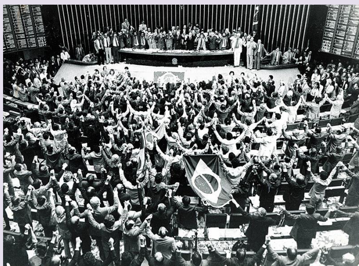
Sessão plenária, no Congresso federal brasileiro, realizada no dia 22 de setembro de 1988, que aprovou o texto final da Constituição Federal de 1988.

Será, somente, na década de 1980 que veremos mudanças consubstanciais no Brasil, no que se refere a uma efetiva política de assistência social. Na esteira das grandes reformas internacionais e nacionais e das lutas por direitos mais efetivos, principalmente, o direito à vida e à liberdade, como resposta ao período ditatorial, resultante do golpe militar de 1964, a sociedade brasileira começa a inaugurar um novo tempo. O processo constituinte marca uma nova perspectiva e realidade para o país e para as pessoas e vê-se o reordenamento político, num processo de redemocratização, marcado pela atualização da lei máxima do país, a Constituição Federal de 1988.