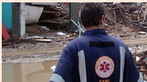
Equipes do SAMU em Alagoas e Pernambuco em 2008

Os esforços, de toda a equipe durante o processo de acompanhamento de famílias em situação de emergências sociais são inúmeros. Para minimizar os danos e garantir o retorno à vida cotidiana possibilitando a reconstrução da vida familiar e comunitária é necessário um trabalho articulado e extremamente atento aos impactos causados por estes eventos. Devem ser facultados