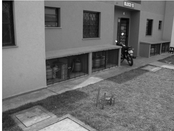
Figura 2: Vista da área comum onde ficam armazenados os botijões de gás dos moradores do Jardim Wilson Toni (Autor: Mariana Siena, nov. 2011).

Eu fiz o agradinho para não roubar o meu boião, porque tavam roubando muito. Só que eles até cobraram barato, olha aqui [entrevistado mostrou o comprovante do agradinho vide figura 3], agora ele já tá cobrando 60, 40 reais.