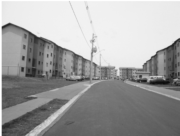
Figura 1: Conjunto de condomínios prediais no Jardim Wilson Toni, Ribeirão Preto/SP (Autor: Mariana Siena, nov. 2011).

Para compreender como a mudança de endereço dos afetados em desastres em Ribeirão Preto/SP resultou na permanência de suas vulnerabilidades e, também, na criação de novas, uma segunda incursão em campo se deu, no final do ano de 2011, pouco tempo após as famílias, da Vila Elisa, terem sido realocadas para o Jardim Wilson Toni (vide figura 1). Nesta segunda incursão a campo optou-se pelo não acompanhamento de assistentes sociais na realização das entrevistas para que os entrevistados se sentissem mais à vontade para expressar, em seus depoimentos, suas opiniões em relação ao meio técnico envolvido na adoção daquela medida recuperativa. Os moradores foram interpelados de forma aleatória pela pesquisadora, nas ruas do bairro, e alguns deles abriram as portas de suas casas para a realização das entrevistas.