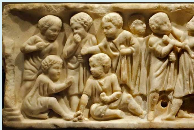
Representação de crianças da Roma Antiga brincando

Tanto na Grécia quanto na Roma antiga, pela análise dos registros históricos, é possível perceber como era concebida a ideia de infância, com vieses de distinção entre meninos e meninas. Para os meninos das classes privilegiadas existia a possibilidade de uma aprendizagem, como ler e a escrever em latim e grego com seus aios, isto é, com professores particulares. Além disso, sobre atividades essenciais à época, como a agricultura, a astronomia, religião, geografia, matemática e arquitetura.