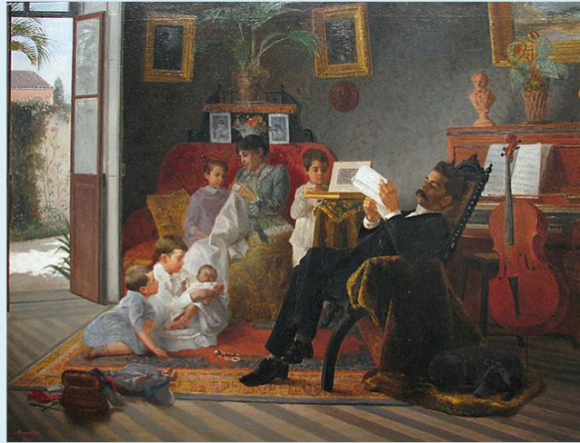
Legenda: Cena de Família, de José Ferraz de Almeida Junior, 1891.

Historiadores afirmam que, no final do século XVII, com o aparecimento da escola moderna, a família começa a dar maior atenção e a organizar-se para a criança, duas coisas em especial vão ser o foco desse olhar diferenciado, a amabilidade e a educação. Com o começo da modernidade a família fortalece a sua função moral e espiritual para com as crianças, não sendo mais dela a responsabilidade de preparar os filhos para as funções e encargos adultos e sim papel da escola, tendo a função de discipliná-los. Sendo assim, a criança abastada torna-se um ser a receber educação, enquanto processo fundante e preparatório para o mundo do trabalho, mais especializado, competitivo e voltado para atendimento das demandas de grandes centros urbanos nacionais e internacionais. Ainda segundo Ariès (1981),