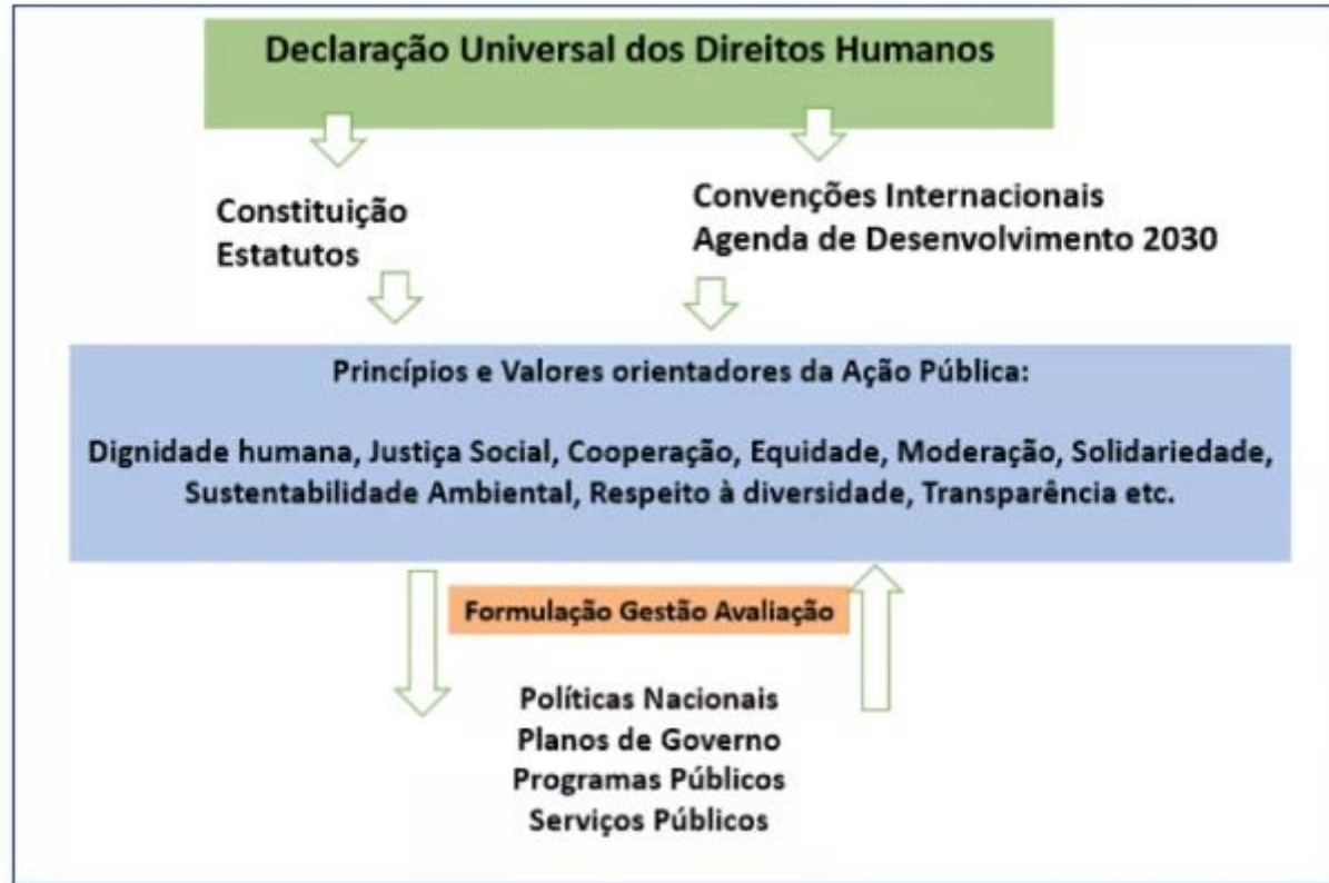
Figura 3: Valores e Princípios de Avaliação de mérito de Políticas Públicas