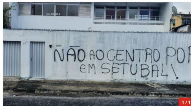
Fachada do imóvel onde seria instalado o Centro Pop foi pichada com os dizeres "não ao Centro Pop em Setúbal!".