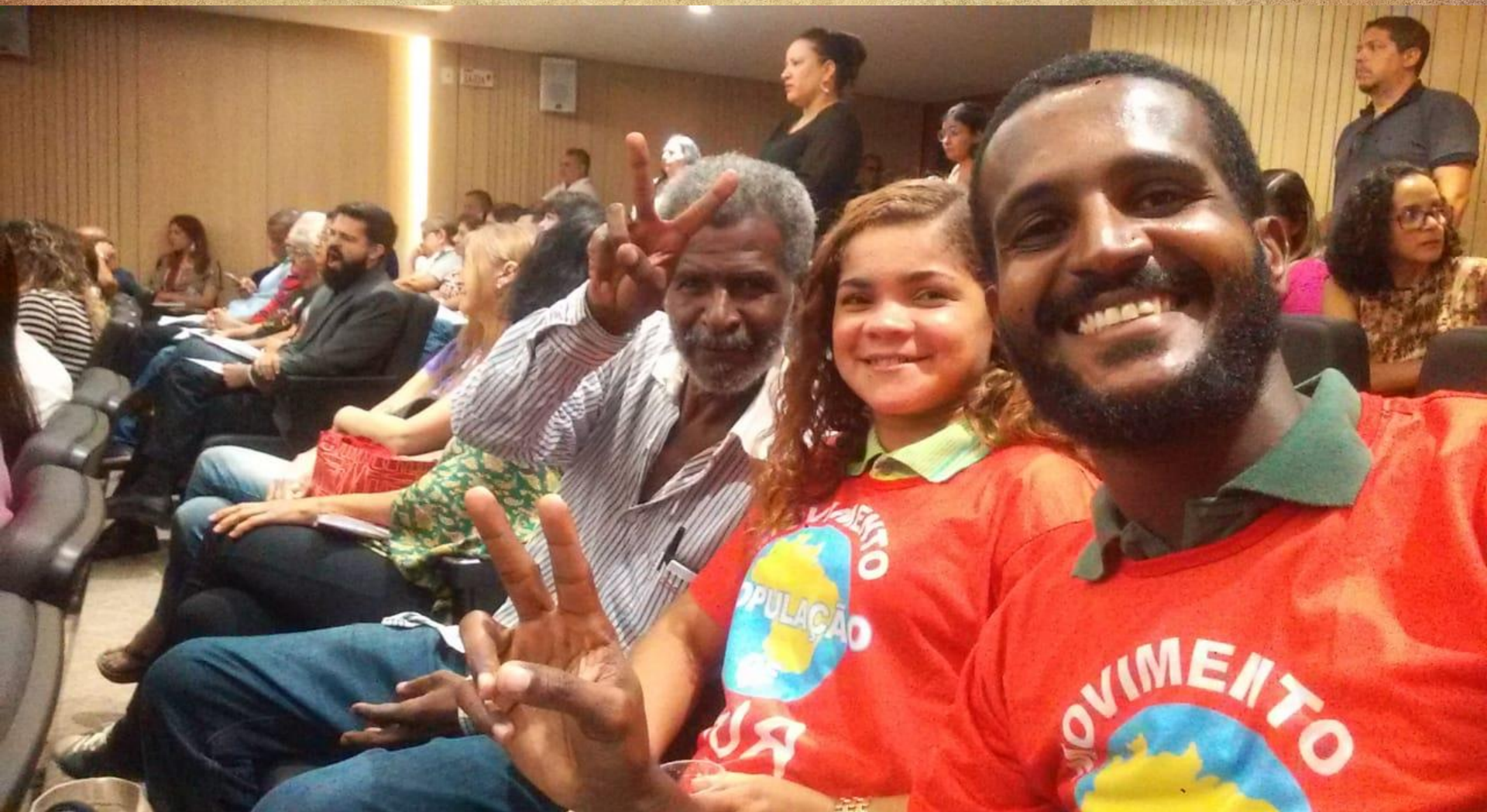
Audiência Pública na ALEPE sobre a Política de Assistência Social