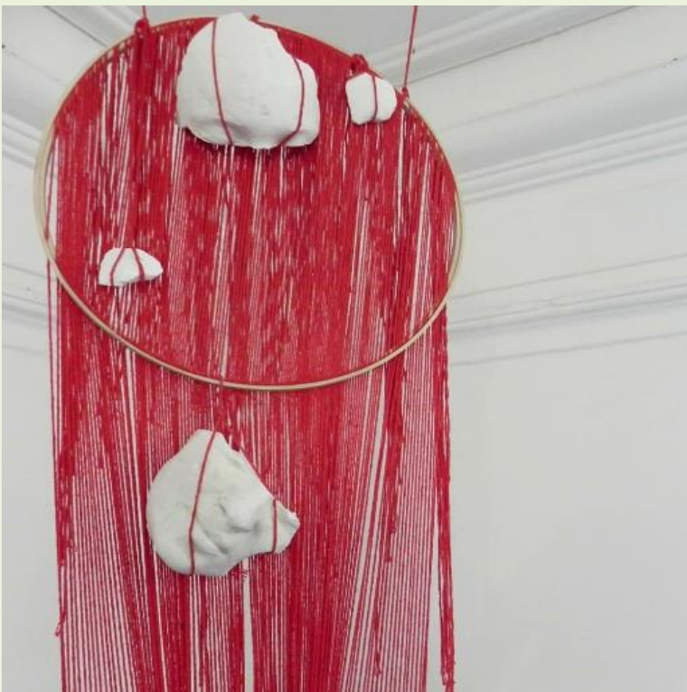
“O surto”, instalação, 2018. Jaci Borba.

Uma tentativa de responder a nossa pergunta “estamos diante de uma quarta onda feminista?” é observar atentamente, cada vez mais espaços se abrem para discutir as especificidades de pautas diversas dentro dos feminismos. Em paralelo seguimos com uma questão ainda latente: afinal, o que é ser mulher? Agora, o que é ser mulher nesta época de percepção de interseccionalidades? As opressões tentam fragmentar a vida das mulheres, permanecer em movimento e conectar as diferenças, ainda que por um fio, é permanecer tecendo ferramentas políticas de transformação social.