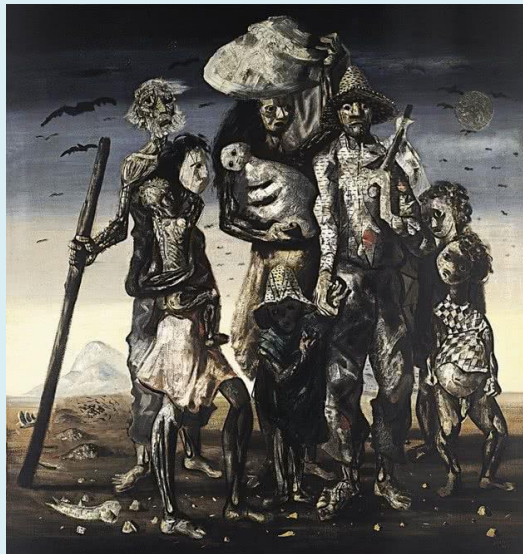
“Retirantes” (1944) – Cândido Portinari

O histórico da migração no Brasil, interna ou internacional, espontânea ou forçada, tem que ser reconhecida como parte fundamental da formação de nossa identidade nacional. A prosperidade econômica e a multiculturalidade que advém deste movimento são aspectos que reconhecemos e enalteçemos sempre que nos convém.