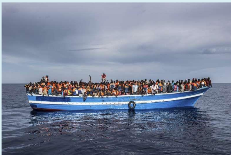
Barco que transportava refugiados e migrantes à deriva no mar Mediterrâneo pouco antes de ser resgatado pela marinha italiana em 2014.