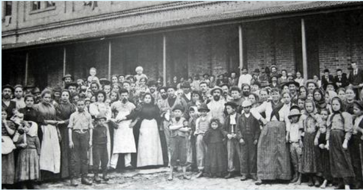
Hospedaria de Imigrantes (São Paulo, SP)

Quando falamos em migração é importante explicar que não se trata apenas de transposição de fronteiras internacionais. A mobilidade humana acontece também, e principalmente, no interior dos territórios. A migração interna, de uma região para outra dentro dos próprios países, ocorrem quase que de forma permanente.